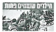
אם צריך, לא נפתח את שנת הלימודים