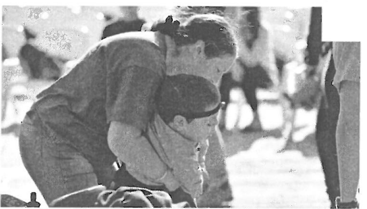
"ילד שלי לא מגיע פחות מכל ילד אחר בחינוך המיוחד"

עבור תלמידי החינוך המיוחד השהייה בבית קשה ביותר, לכן הם נמצאים במסגרת חינוכית עד אמצע אוגוסט. "זה יהיה מאוד קשה, אבל אם נתקבל החלטה לא לפתוח את שנת הלימודים, אני אלך איתם יד ביד. אני חושבת שמגיע לילד שלי לא פחות מכל ילד אחר בחינוך המיוחד", מבהירה סמדר.